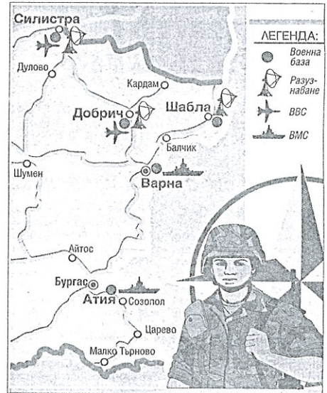
В Шабла, Добрич или Силистра ще бъде американската ВВС-база, АТИЯ и Варна са удобни за ВМС-бази.