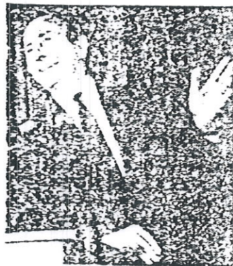
г-н Вьорнер 64-годишен опит като лидерът в Бундестага Той започва да говори на 15 стр.

От 10.30 Манфред Вьорнер има закрита среща с Бюрото на ВНС и ръководителите на парламентарните групи. Присъства и посланикът на САЩ г-н Хю Кенет Хил. От срещенът на парламента ни информира, че Генералният секретар на НАТО е говорил за